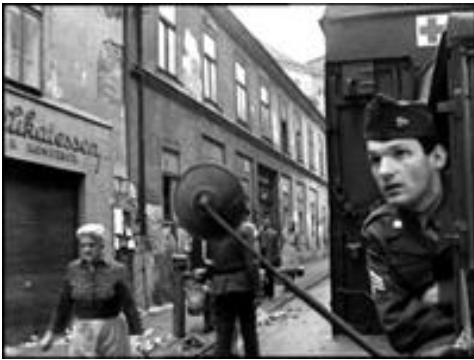
Illustration du « raccord de regard » :