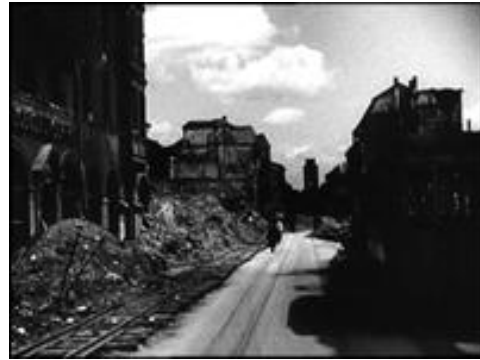
L'arrivée à Vienne dans « Welcome in Vienna » (Axel Corti, 1986)