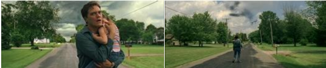
Take shelter (Mike Nichols, 2011)

La règle des 180° s'applique également dans les scènes en mouvement. L'axe des 180° est alors l'axe de l'action. Par exemple, dans le cas d'un vélo ou d'un personnage se déplaçant sur une route, celle-ci constitue l'axe des 180° : la caméra devra se trouver toujours du même côté de la route.